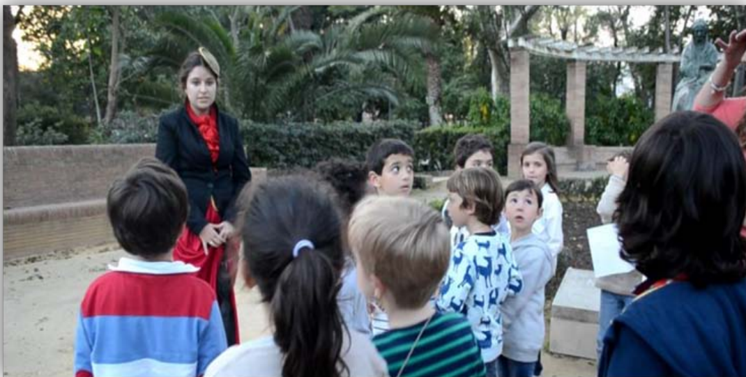
FIGURA 5. Actividad: “¿Quién es María Luisa?”.

En el último lugar del corrido se realizarán las dos últimas actividades, la primera nos ayudará a conocer los orígenes del parque y de su característico nombre (“¿Quién es María Luisa?”). Se dirigen hacia el monumento María Luisa, quien da nombre al parque, donde se realizará una pequeña escenificación teatral, desarrollada por dos personajes, que pretenden dar a conocer las diferencias entre la vida en siglo XIX, época de “María Luisa” y nuestra época actual. Los niños y niñas participan en el teatro y se reviven escenas cotidianas de ambas épocas (FIGURA 5). Esta es la última actividad de desarrollo del Itinerario Didáctico, se puede ver en video en el siguiente enlace: https://www.youtube.com/watch?v=OArBXXvXngw