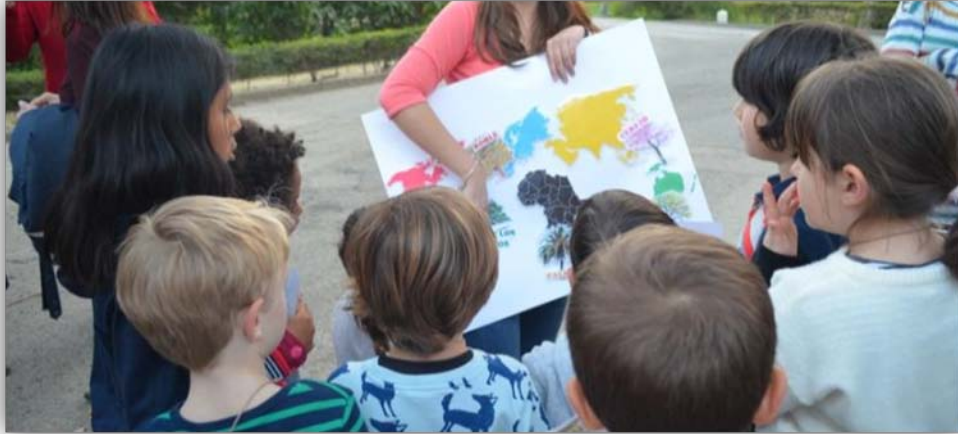
FIGURA 4. Actividad: “El árbol de las lianas”.

procedencia, y no solo por la de este árbol sino por todas las de los árboles y plantas del parque. En esta actividad conocerán más especies alóctonas que tenemos en el parque, y para ello, se les facilitará unas pistas que deberán buscar con la misma dinámica que las de la anterior actividad. A su regreso cada grupo explica a los demás compañeros/as las características del árbol y su procedencia. Por tanto, finalmente formamos un mapamundi con la procedencia de cada uno, su dibujo y su nombre (FIGURA 4).