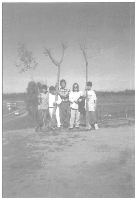
La "pose" típica.