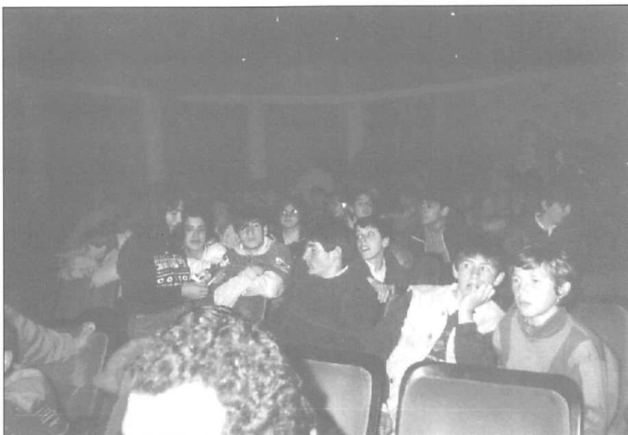
Asistencia a las charlas y proyecciones didácticas.