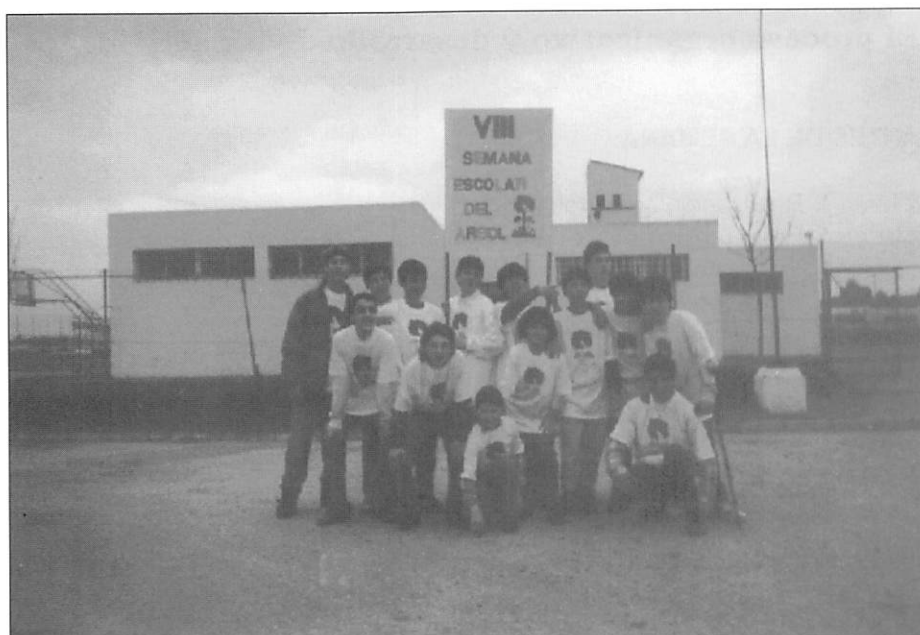
Grupo de alumnos del Centro organizador