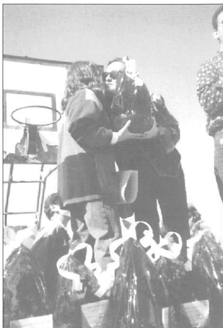
Acto de Clausura: entrega de premios.