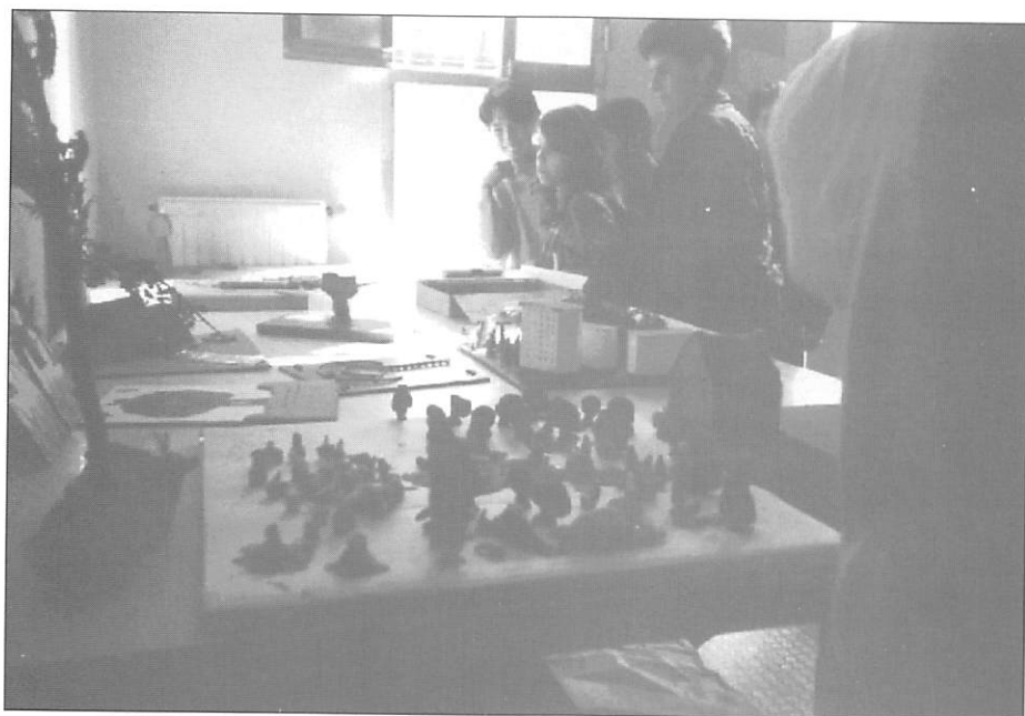
Algunas muestras de los trabajos presentados.