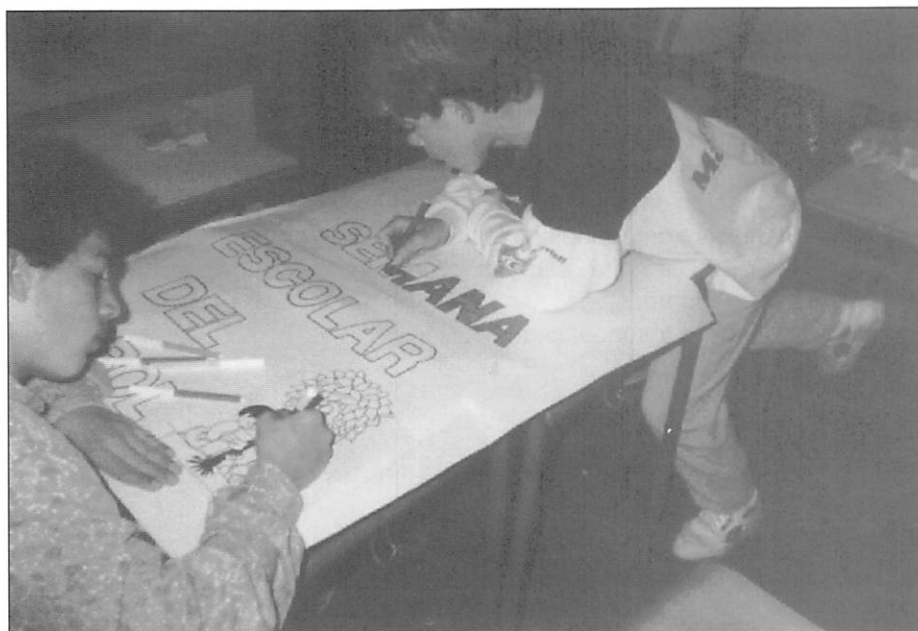
Confección de los carteles anunciadores