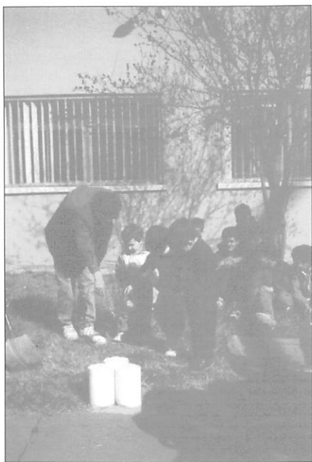
¡Hasta los más pequeños!