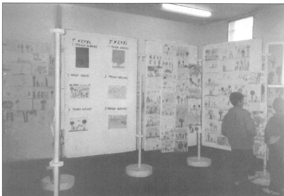
Vista general paneles expositivos.