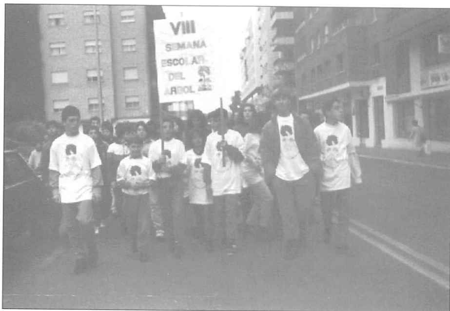
Cabeza de la marcha simbólica por las calles.