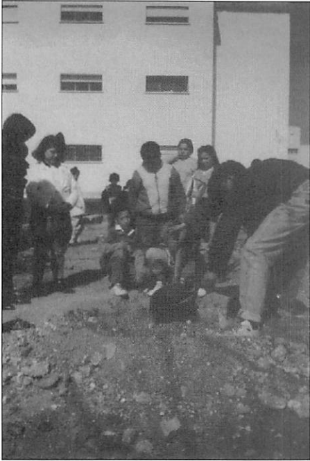
Plantaciones por grupos.