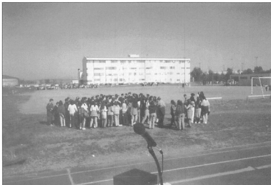
Acto de Clausura: trabajo en grupos.