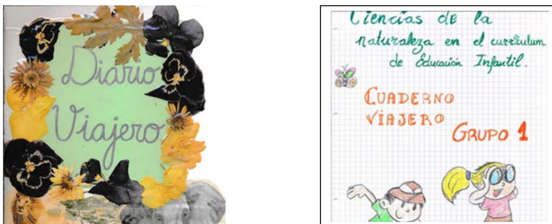
Figura 1: Portadas de los cuadernos viajeros decoradas espontáneamente por alumnas

Brown (2007) valora el uso de diarios en la educación superior como recurso innovador que potencia el aprendizaje al estimular la reflexión, estructuración, síntesis y análisis de lo trabajado. Zabalza (2004) por su parte destaca la utilidad y versatilidad del diario en la formación del profesorado; su redacción supone un ejercicio de autodisciplina que ayuda a desarrollar una conciencia crítica sobre el propio proceso de aprendizaje y es en sí mismo una herramienta de investigación educativa (Porlán y Martín, 1991) que el profesorado en formación debe conocer de manera práctica. Por ello, durante el curso 2012-13, como innovación docente e instrumento de evaluación, se propuso al alumnado la realización de un “diario viajero” (Figura 1), en la línea de los cuadernos viajeros que se emplean en educación infantil para favorecer el contacto con las familias y su participación en el proceso educativo. Este documento se analizó junto a otras producciones del alumnado.