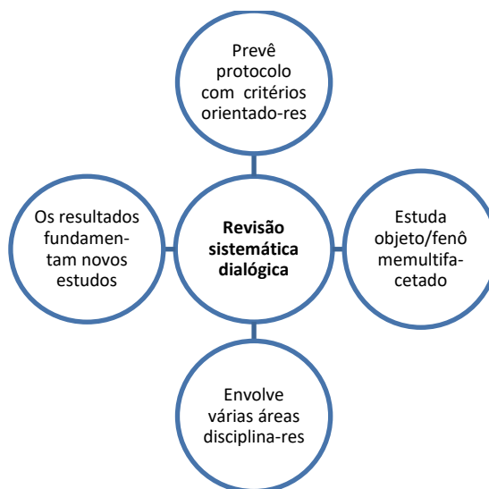
Figura 2. Esquema com elementos da revisão sistemática dialógica.

estudos da filosofia da linguagem, Canevacci (2004) revitaliza esse conceito no contexto dos estudos da cidade. Esse último autor apresenta contribuições consistentes a nossa proposição de revisão sistemática, pois, ao defender o conceito de cidade polifônica, destaca que é preciso considerar diferentes vozes na apreensão de complexidades, riqueza de detalhes e inteireza que se expressam na cidade, como forma e conteúdo. Segundo o autor, é necessário ver, ouvir e sentir a cidade. Perceber seus fluxos, ritmos, sons, cores, silêncio, comunicação, dentre outros elementos. Nessa perspectiva, os estudos da cidade envolvem diferentes áreas e, por isso, denominamos nosso levantamento como uma revisão sistemática dialógica, conforme sintetizado no esquema da figura 2.