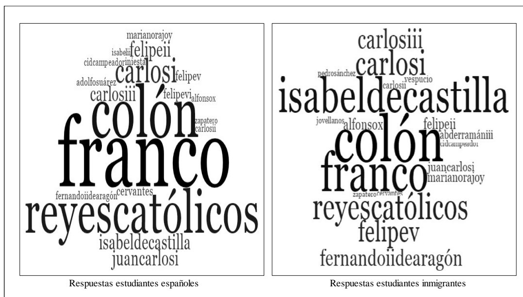
Figura 2. Esquema de comparación entre el IR de los 20 personajes más importantes en la muestra de estudiantes españoles y el IR de los personajes mencionados por estudiantes migrantes asociados a una identidad histórica conversa

3) Isabel de Castilla, IR=28; 4) Reyes Católicos 1 , IR=20; 5) Carlos I/Carlos V, IR=19–, concuerdan con las cinco primeras referencias del núcleo central de evocación de la muestra general de estudiantes españoles –1) Franco, IR=1509; 2) Colón, IR=1082; 3) Reyes Católicos, IR=900; 4) Carlos I/Carlos V, IR=461; 5) Isabel I de Castilla, IR=271–. Esta situación es similar en los demás personajes del listado, con excepción de tres referencias cuya ubicación en el listado definitivo del grupo A establece diferencias significativas entre muestras: Abderramán III, Américo Vespucio y Gaspar Melchor de Jovellanos. El primero ocupa la casilla 13 según su IR en el listado de la tipología de identidad conversa, y está ubicado en la posición 103 del listado general de la muestra de estudiantes españoles; el segundo está situado en las posiciones 15 y 41, y el tercero está posicionado en las casillas 16 y 37, respectivamente. Es importante tener en cuenta, que la presencia de personajes como Abderramán III y Américo Vespucio, podrían ser muestra de fisuras en el esquema identitario tradicional, las cuales en el caso específico de los estudiantes migrantes pueden establecer una transición hacia posturas más inclusivas o hasta cierto punto más globales en comparación a las manifestadas por el estudiantado español.